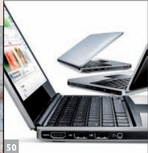
Neue mobile Welten: Was künftig alles möglich ist.