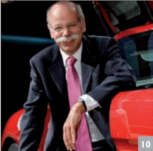
Global einen Schritt weiter: Was Familienbetriebe anders machen.